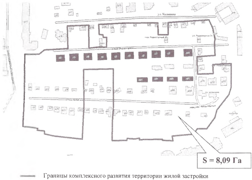
Схема границ территории комплексного развития жилой застройки в районе ул. Калинина и ул. Радиаторной в городе Липецке